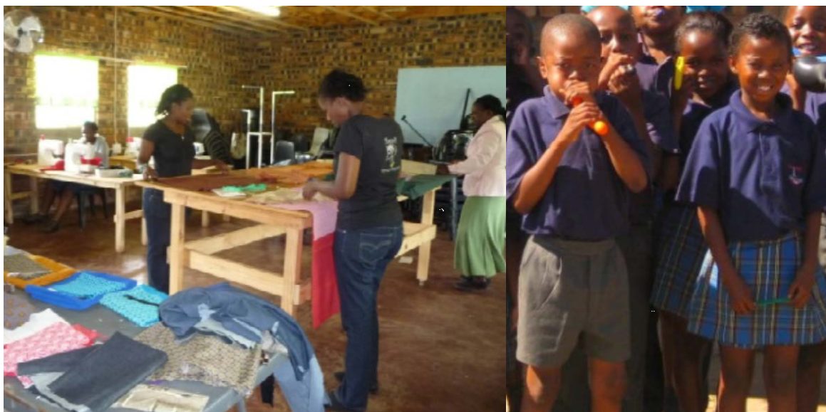
Fotos: Die Schneiderinnen produzieren und verkaufen mittlerweile auch Schuluniformen (rechts)

finanziell selbst trägt und somit auf keine weiteren externen Fördermittel mehr angewiesen ist. Damit wäre die „Hilfe zur Selbsthilfe“ erfolgreich abgeschlossen.