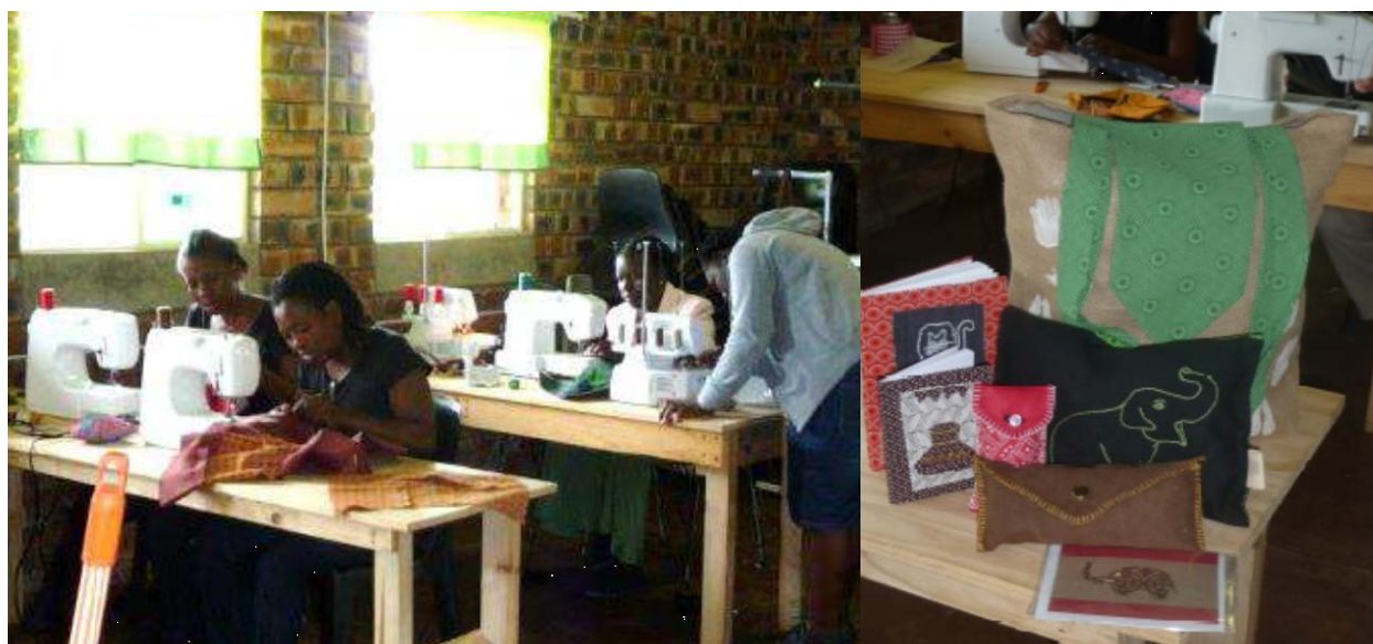
Fotos: Drei Schneiderinnen mit einer Ausbilderin (links) stellen Taschen und Mäppchen her (rechts)

Seit 2013 unterstützen wir gemeinsam mit dem Verein Mohau das Projekt “SCHNITTstelle“ in Südafrika. Das Handarbeitsprojekt bietet im Bereich Ausbildung und Einkommenssicherung mittellosen und in Armut lebenden Frauen eine Möglichkeit ihr Leben selbstbestimmt und nachhaltig zu führen. Im Projektort Fobeni Village in Südafrika liegt die Arbeitslosigkeit bei 92%, viele Familien sind daher gezwungen am Existenzminimum zu leben. Die meisten Familien leben von weniger als 10 Rand (<1Euro) pro Person/Tag. Dies führt zu schlechten gesundheitlichen, sozialen, mentalen und emotionalen Lebensbedingungen der ganzen Familie. Zudem ist HIV/Aids im Projektgebiet weit verbreitet, viele Frauen sind bereits infiziert und deren Kinder werden bereits mit dem HI-Virus geboren. Da der Zugang zu Medikamenten und Ärzten oft nicht erreichbar und finanzierbar ist, sterben viele Familienmitglieder oft schon sehr jung. Viele Frauen und Kinder leben daher alleine und sind auf sich selbst gestellt, meist sind die Frauen die Alleinversorger der Kinder.