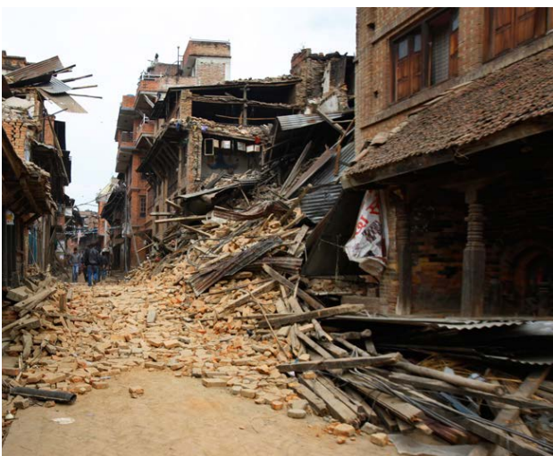
Foto: Eine Straße in der Hauptstadt Kathmandu, einen Tag nach dem Erdbeben. © Niranjana Shrestha/dpa

weitere internationale Hilfsorganisationen, sowie internationale Entwicklungshilfeagenturen und Katastrophenbergungsteams unterstützen die Menschen mit medizinischer Hilfe, Zelten, Lebensmitteln und führen die Bergungsarbeiten fort. Der Verein OneLoveOneWorld ist sehr um den weiteren Verbleib und die Betreuung von (Klein-) Kindern besorgt. Viele Eltern müssen, trotz des Notstandes, versuchen Geld zu erwirtschaften und haben keine andere Möglichkeit als ihre Kinder tagsüber alleine zu lassen. Deshalb wird momentan überlegt zusätzlich eine mobile Kindertagesstätte einzurichten. Wir haben uns deshalb entschieden OneLoveOneWorld durch eine Sofortspende zu unterstützen.